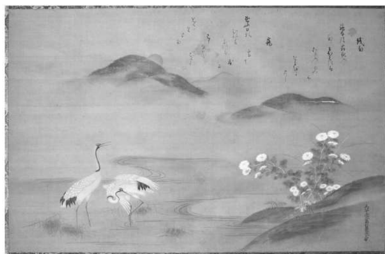
土佐 光祐「定家詠花鳥和歌 神無月歌意図」 江戸中期・18世紀初頭